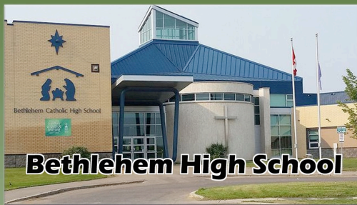
Bethlehem High School