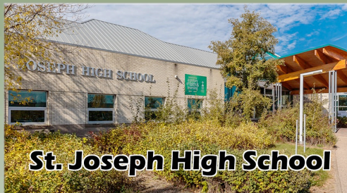
St. Joseph High School