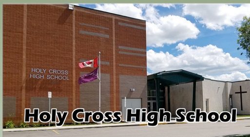
Holy Cross High School